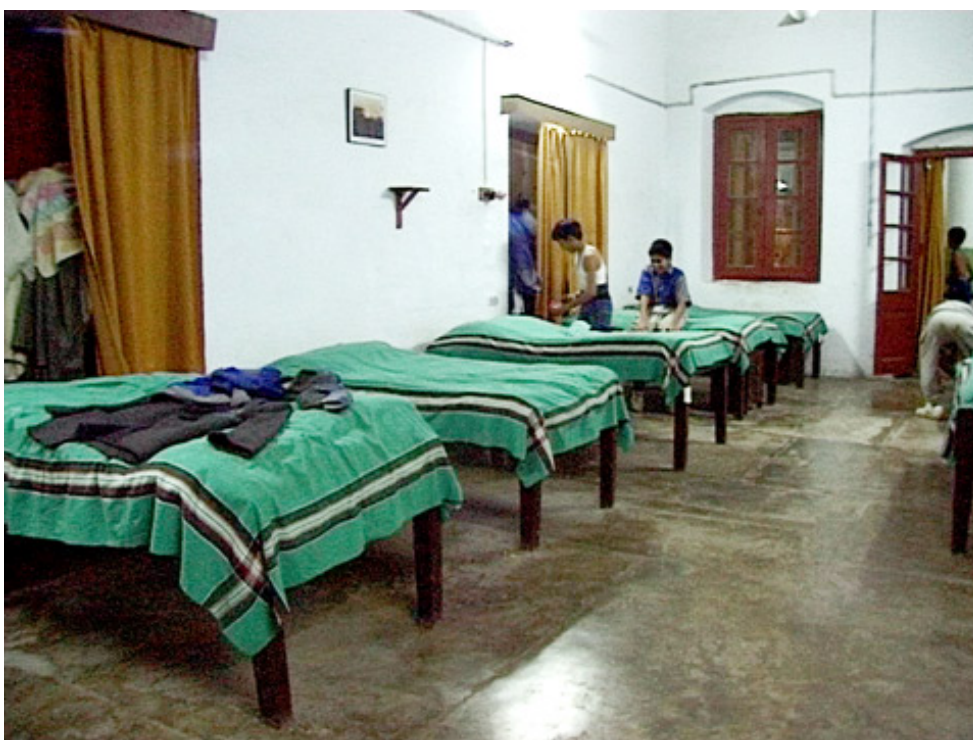
4. Un dortoir de l'école (photographie de l'auteur, 1997)

De même que celles des uniformes, les couleurs utilisées à l'intérieur des bâtiments sont soumises à des restrictions. Les sols sont recouverts de ciment ou de dalles grises et les murs sont blanchis à la chaux : aucune couleur ne vient rompre cette uniformité, excepté le bois sombre des pupitres dans les salles de classe et les couvre-lits colorés dans les dortoirs. Les couvre-lits des chambrées sont tous soit verts soit bleus, mais jamais les deux. Chaque dortoir offre ainsi l'image d'une couleur unique qui tranche sur un fond beaucoup plus vaste et dénué de couleur. L'utilisation du vert et du bleu maintient le contraste entre couleurs froides et couleurs chaudes, contraste qui est également présent dans la distinction établie par A. E. Foot entre l'institution et le corps de l'élève. Ce choix de coloris est restreint, voire sévère, mais il fait ressortir la couleur de la peau, principale manifestation de vitalité humaine dans ces dortoirs. Mais la nuit venue, les garçons se retrouvent captifs des couvre-lits verts et bleus de l'institution [13].