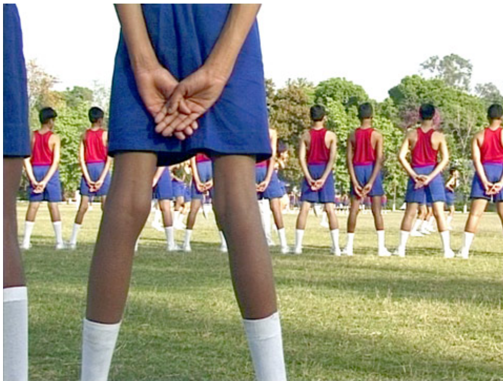
6. La compétition annuelle de gymnastique (photographie de l'auteur, 1997)

Les sports d'équipes comme le football ou le hockey – sorte de rituels pratiqués dans un espace rectangulaire – tiennent une place importante dans l'emploi du temps scolaire, de même que le cricket et son assortiment de règles et de mesures. Quant à la gymnastique, elle donne lieu à des compétitions où les houses rivalisent entre elles pour présenter des corps aux mouvements parfaitement coordonnés.