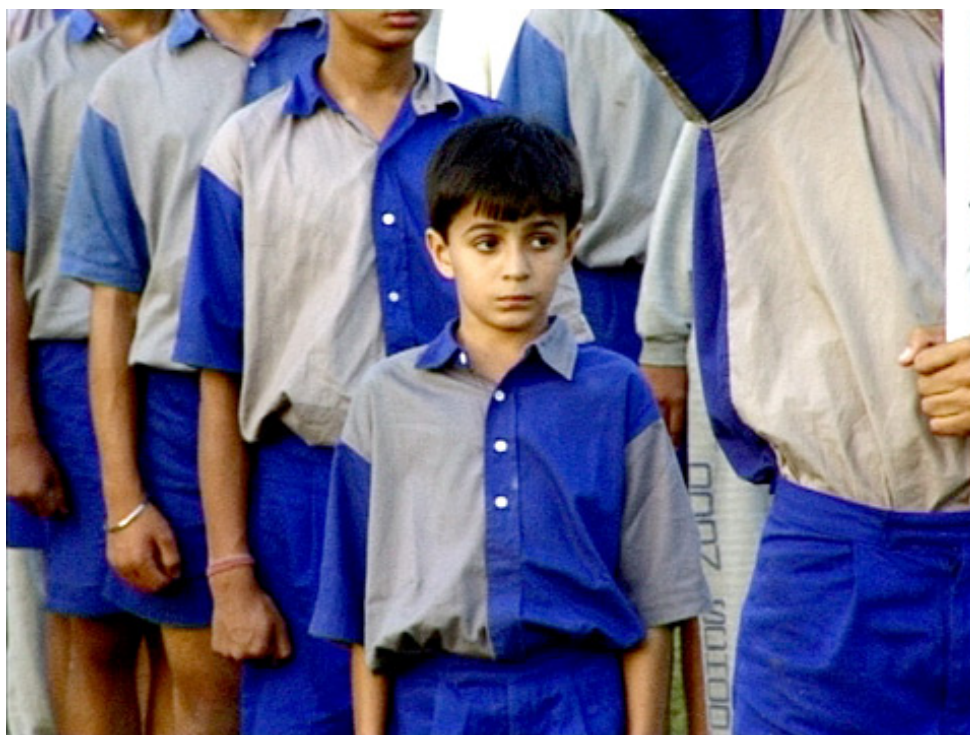
1. La tenue de sport de la Doon School (photographie de l'auteur, 1997)

Pensionnat d'élite pour garçons, la Doon School est réputée pour son campus verdoyant, situé sur le domaine de Chandbagh, en Inde du Nord. Ce domaine accueillait jusqu'en 1933 le Forest Research Institute and College . Les élèves de l'école ont ainsi hérité d'un jardin botanique extraordinaire qui, sur quelques 28 hectares, renferme plusieurs centaines d'espèces d'arbres ainsi que des massifs de fleurs et d'arbustes. Quand je visitai l'école pour la première fois en 1996, je fus frappé par son caractère verdoyant. C'était la période des vacances et les élèves étaient partis en excursion. Je me souviens d'arbres gigantesques de toutes sortes, mais aussi, au centre du domaine, d'un vaste terrain de sport bien vert, entouré de dortoirs et de bâtiments. De retour à l'école en avril, j'aperçus des éclats de bleu au travers du feuillage, la couleur de la tenue de sport de l'école composée d'un short bleu foncé et d'une chemise alternant des pans bleus et gris. À l'incontournable présence du vert s'ajoutait celle tout aussi incontournable du bleu.