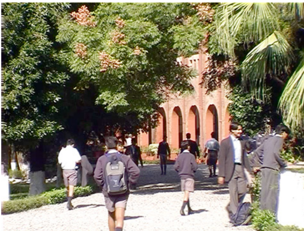
2. Le bâtiment principal de l'école

Dans l'école, on l'a vu, le vert domine : c'est la couleur de la végétation, des terrains de jeu et même des perroquets. Omniprésente, elle constitue la toile de fonds inconsciente de toutes les activités scolaires. Couleur de la nature, le vert semble en effet s'opposer à l'ordre humain, représenté par les bâtiments et le mur d'enceinte. À côté des arbres imposants, les élèves en bleu et gris, qui se regroupent pour célébrer leurs rituels sportifs ou scolaires, semblent minuscules et sans commune mesure avec le cadre végétal. En réponse, les bâtiments de l'école affichent des couleurs plus chaudes et certains d'entre eux, dont la maison d'origine du Forest Research Institute, sont rouge brique. Comme pour renforcer cette couleur, d'autres édifices sont également peints en rouge [7]. La plupart possèdent des toits rouges. Les murets qui bordent les allées sont peints en rouge, de même que les arches du viaduc qui autrefois apportait l'eau au domaine. Le théâtre de plein air, le Rose Bowl, est d'une teinte rougeâtre, comme l'évoque également son nom. Le vert et le rouge forment ainsi un couple d'opposés au sein de l'école, qui semble toutefois se limiter à l'environnement physique.