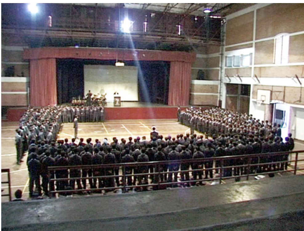
5. La grande assemblée des élèves (photographie de l'auteur, 1997)

D'autres traits de la vie de l'école relèvent d'une même attitude quasi scientifique à l'égard des chiffres et des mesures. L'école continue de noter deux fois l'an la taille et le poids de tous les élèves, même si cette pratique ancienne ne semble plus servir à grand-chose en termes de santé ou de régime. Chaque garçon reçoit un numéro à son inscription. Utilisés par l'administration pour enregistrer les notes et garder la trace des vêtements scolaires, ces numéros servent également dans la vie quotidienne à rassembler les élèves. Cela ne signifie pas qu'on évite de les appeler par leurs noms, ou qu'ils ont le sentiment d'être réduits à un numéro : la pratique semble en effet très bien acceptée, voire respectée comme un signe de modernité. Les élèves sont d'ailleurs plutôt fiers de leur numéro qu'ils insèrent parfois dans leur adresse de messagerie, et dont ils se souviennent longtemps après avoir quitté l'école.