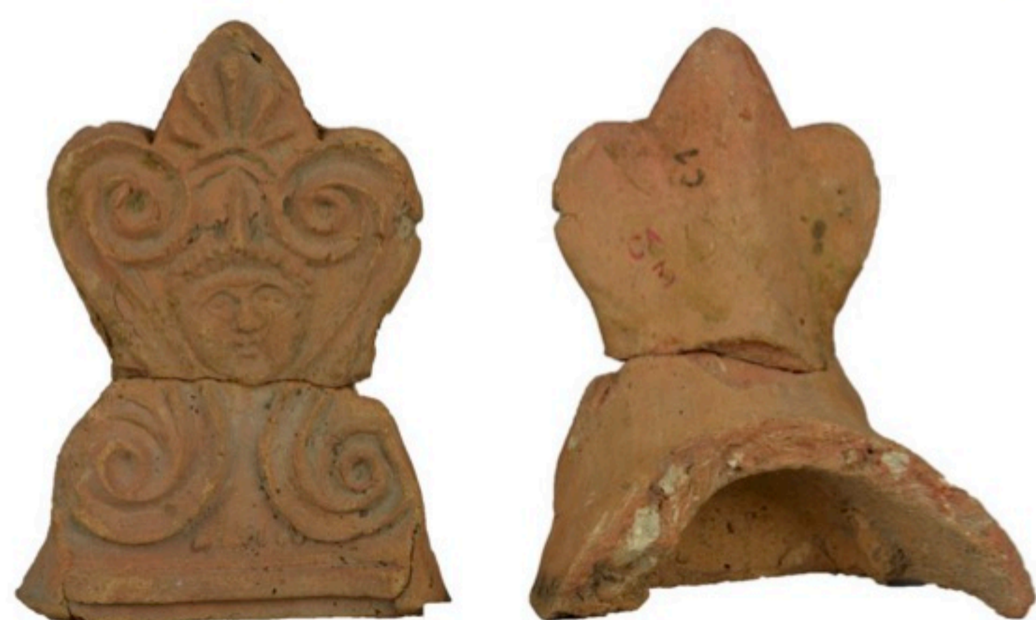
Antéfixe découverte à Autun (Saône-et-Loire)