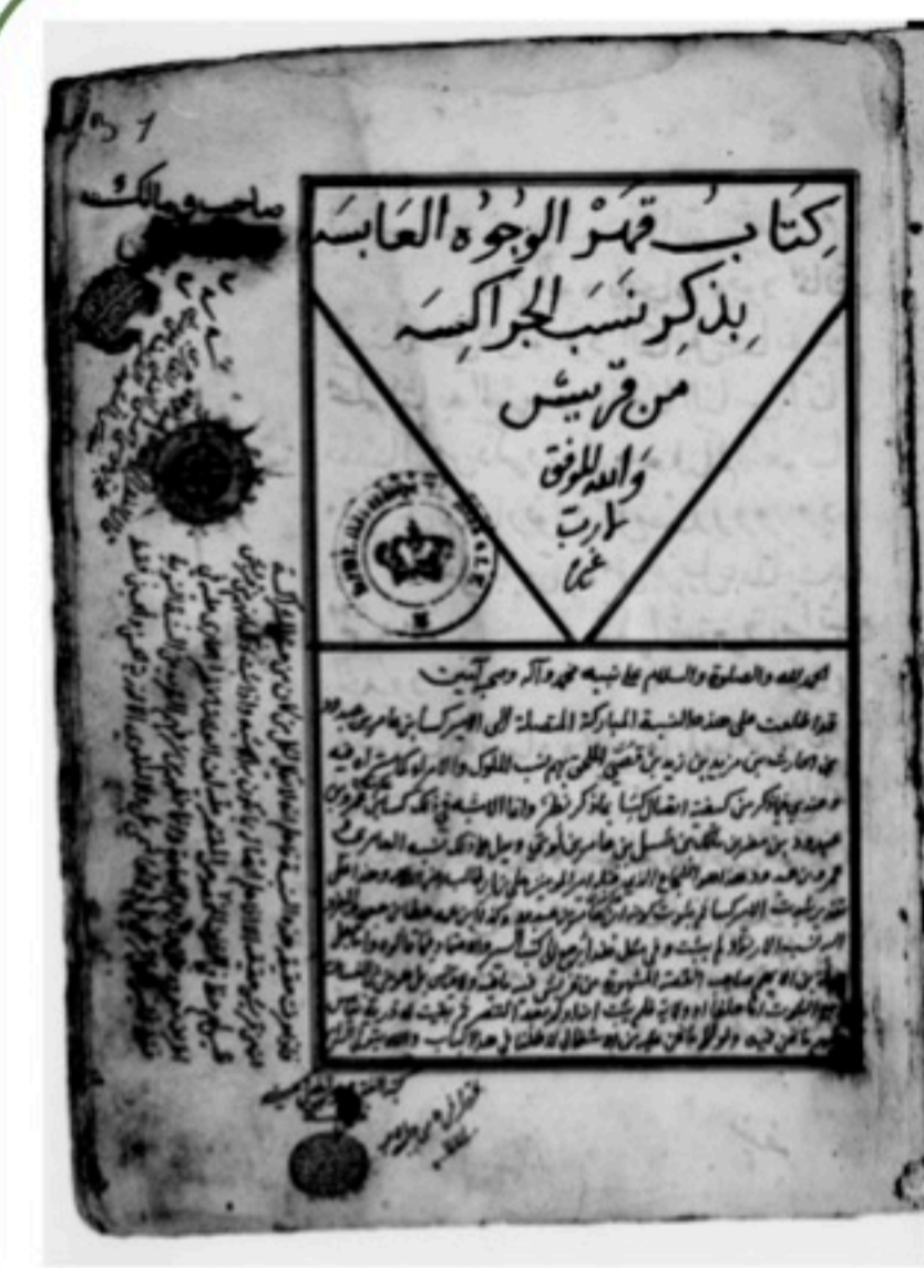
Auteur anonyme, Qahr al-wujūh al-'abāsa bi-zikr nasab al-Jarākisa min Quraysh Manuscrit du XVII e siècle rattachant les Circassiens à une généalogie arabe

Le point de départ de cette étude est le récit d'un chroniqueur égyptien du nom d'Ibn Iyās (mort après 1522), auteur des Badā'i' al-zuhūr fī waqā'i' al-duhūr . Il tente d'établir dans son récit un lien supposé entre les banū Ghassān, célèbre tribu arabe chrétienne, et les sultans circassiens installés sur le trône d'Égypte depuis 1382. Il reconstitue pour cela un itinéraire précis depuis le Yémen jusqu'au Caire. Il s'agit dans un premier temps de remonter l'origine de cette légende, et de savoir par quels canaux et mécanismes elle s'est retrouvée en Égypte.