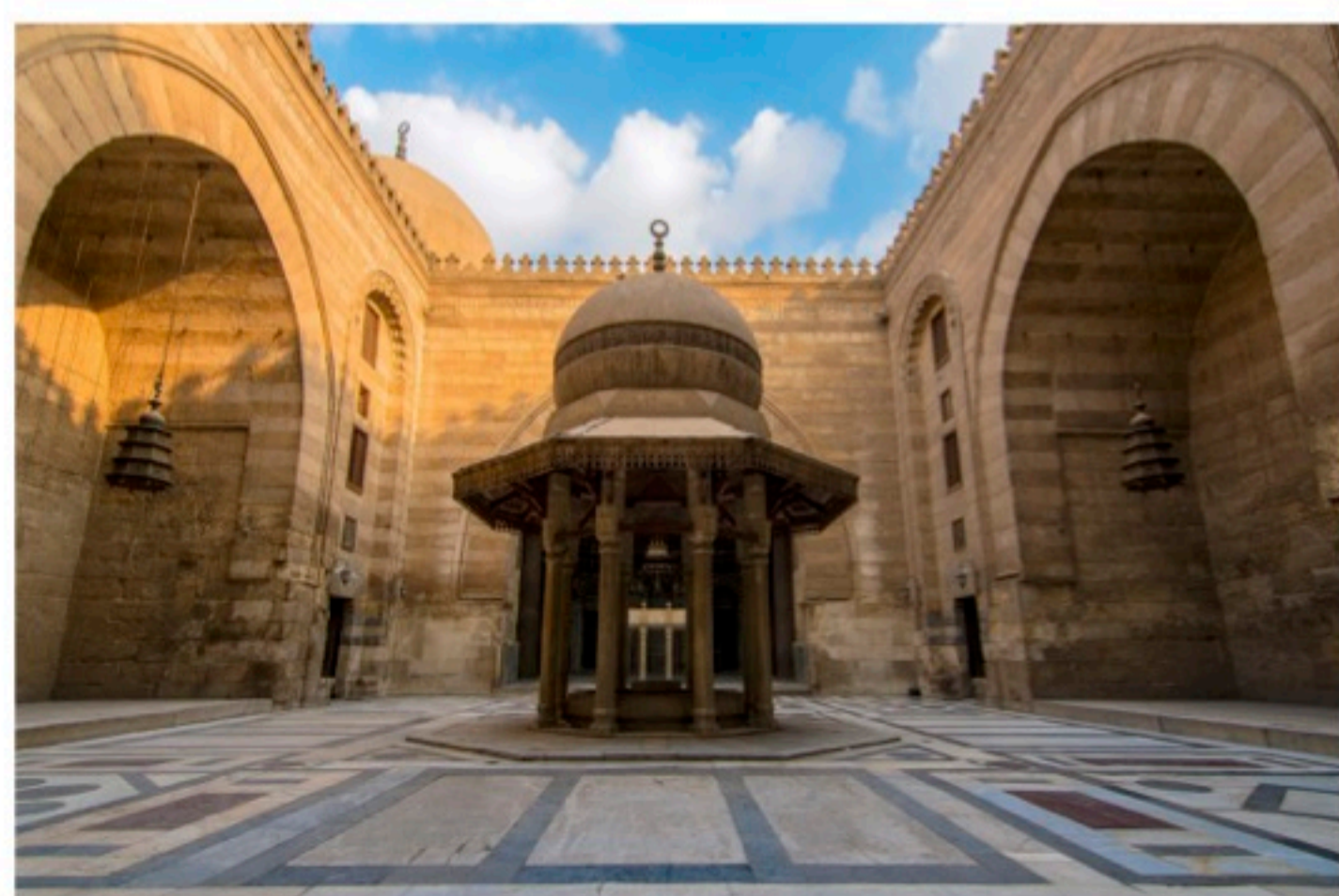
Intérieur de la mosquée-madrasa de Barqūq, fondateur de la dynastie circassienne Crédit : Mohamed Moussa, 2019, Le Caire