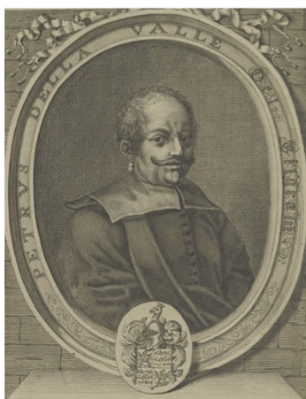
Portrait de Pietro Della Valle (1586-1652), gravure sur cuivre attribuée à Thomas Hirschmann (fin XVII e siècle), Leipzig, Universitätsbibliothek Leipzig, Porträtsammlung, Nr. 54/65