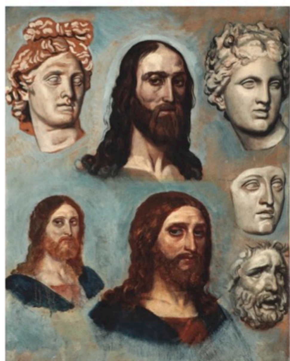
Esquisse romaine d'Alexandre Ivanov, Les têtes d'Apollon de Belvédère, de Vénus de Médicis, de Laocoon, un masque antique et trois variations de la tête du Christ, les années 1840