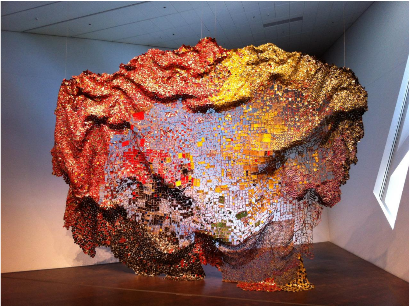
El Anatsui, Stressed World , aluminium et fil de cuivre, 2011, Jack Shainman Gallery, New York.