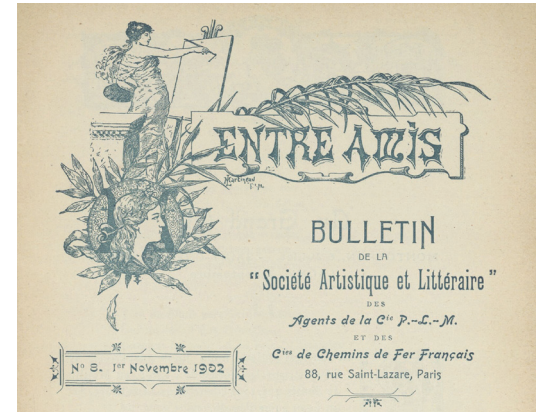
Frontispice de Entre amis , n°8, 1 er novembre 1902, p. 3 (détail).

MARDI 14 MAI 2024 DE 14H À 16H GALERIE COLBERT SALLE VASARI (1 ER ÉTAGE) 2 RUE VIVIENNE 75002 PARIS ENTRÉE LIBRE